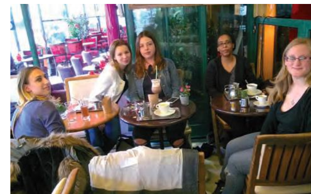
Le groupe "Jeunes & Femmes" de la Mission Locale Nord Essonne

Les prises de rendez-vous avec le CPEF/PMI et le CDPS illustrent ce réinvestissement du corps et une préoccupation pour leur état de santé.