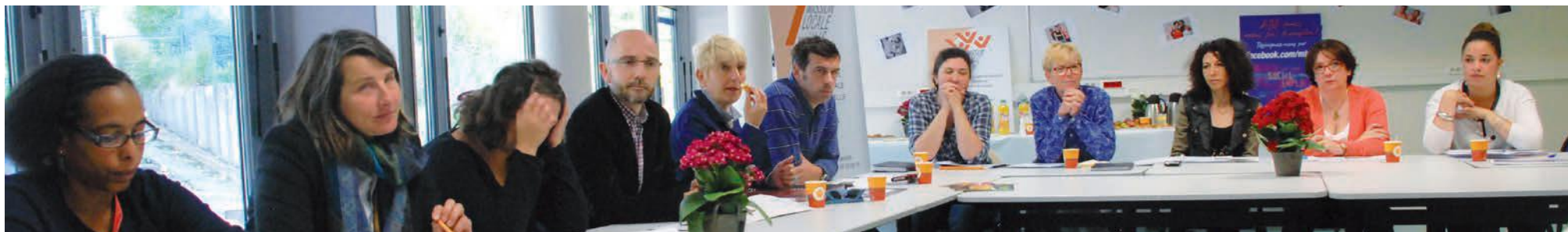
Les partenaires de l'action Jeunes & Femmes - COPIL juin 2015