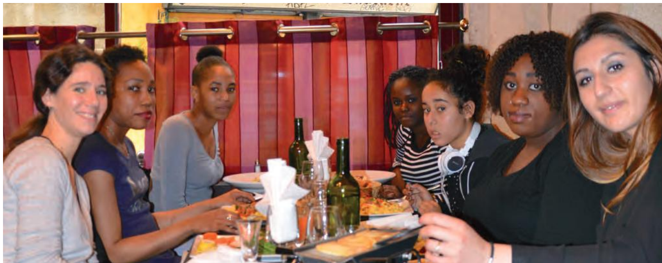
Le groupe "Jeunes & Femmes" de la Mission Locale de Grigny

En individuel, d'autres faits sont à relever : certaines ont osé se séparer d'un conjoint violent, souvent quelques mois après le stage.