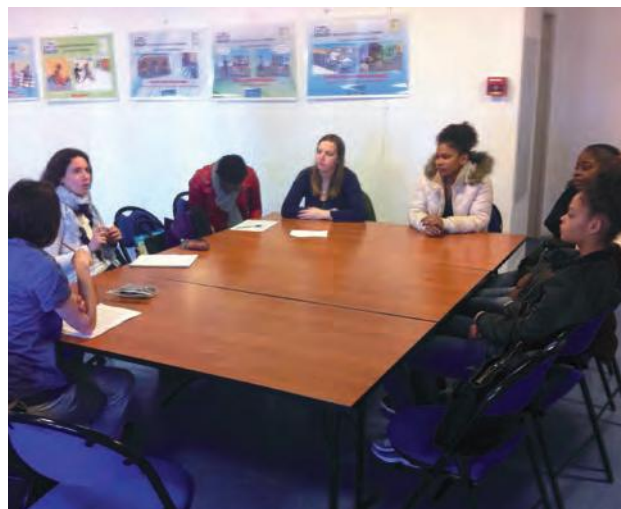
Le groupe "Jeunes & Femmes" de Dynamique Emploi

Les ateliers proposés par la CPAM apportent des informations et des solutions concrètes sur l'ouverture des droits (la CMU et la CMU-C), sur la distinction avec les prises en charge à 100%, sur le fonctionnement des remboursements et la complexité administrative de la CPAM.