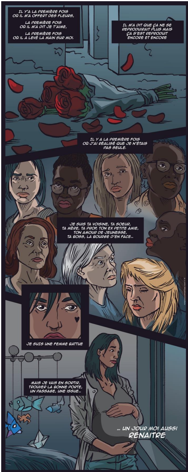
Tableau 7 Comment renaître