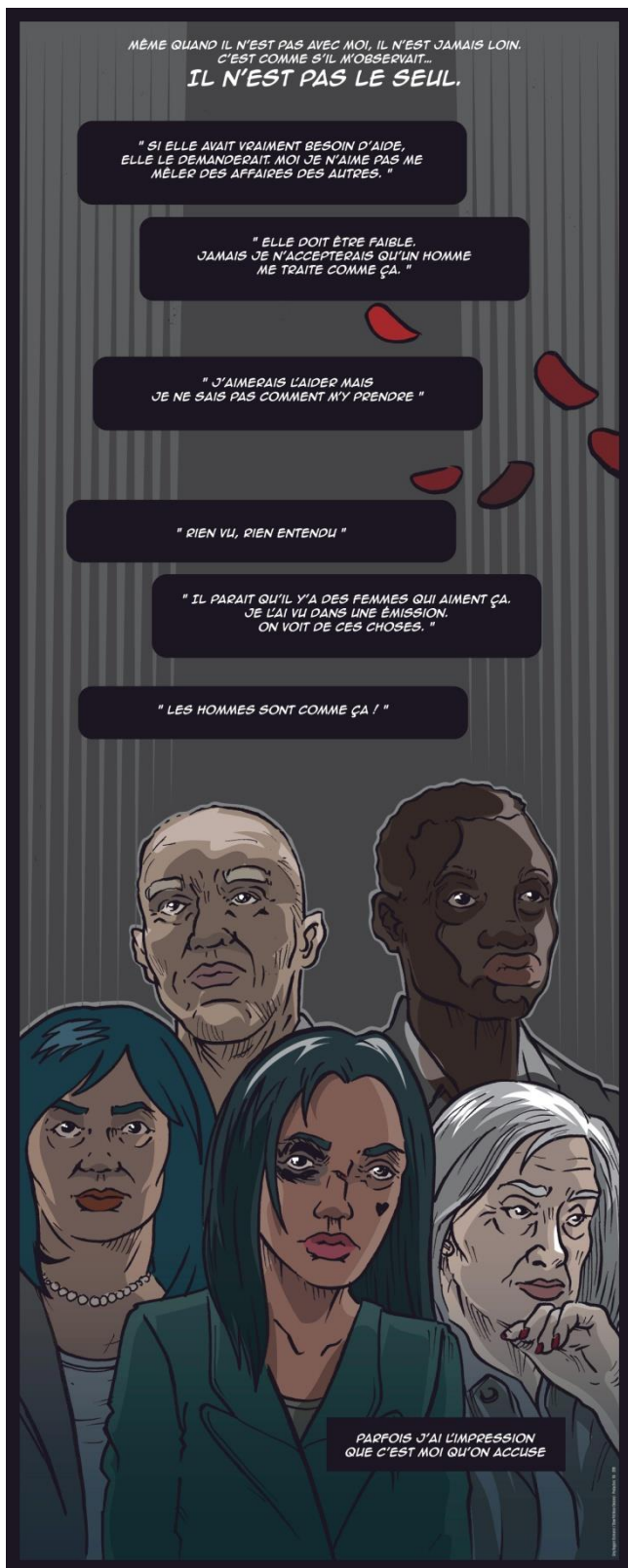
Tableau 6 L'ascenseur

La scène se passe dans l'ascenseur chaque personnage ayant une idée précise sur le sujet (voir les bulles)