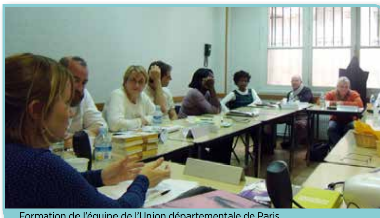
Formation de l'équipe de l'Union départementale de Paris