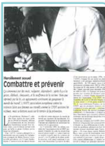
CFDT Magazine n° 220 - Nov 1996