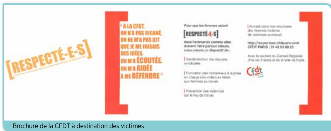
Brochure de la CFDT à destination des victimes