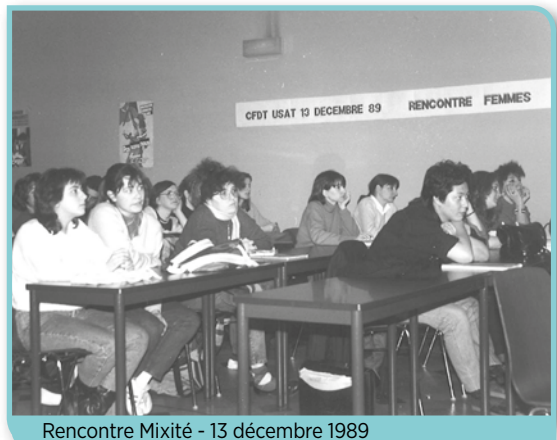
Rencontre Mixité - 13 décembre 1989

dans leurs entreprises, ainsi que pour ceux qui ne respectent pas la dignité des femmes ».