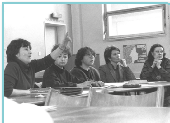
Rassemblement de militantes - 8 mars 1984

Les premières lignes de l'ouvrage (l'édito) sont écrites par Jeannette Laot, toujours secrétaire nationale CFDT à cette époque : « Au cours de plus de quinze années d'action et de réflexion sur les causes de la surexploitation des travailleuses, la CFDT a élaboré une politique revendicative originale liant étroitement lutte des classes et libération des femmes. Elle est la seule susceptible d'aboutir à la suppression des inégalités et des discriminations que subissent les travailleuses dans et hors de l'entreprise ».