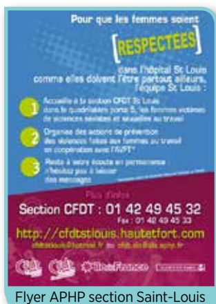
Flyer APHP section Saint-Louis