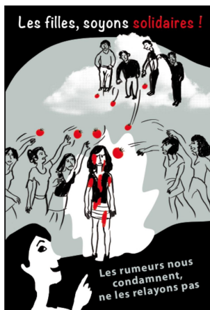
Collège Robespierre /Epinay