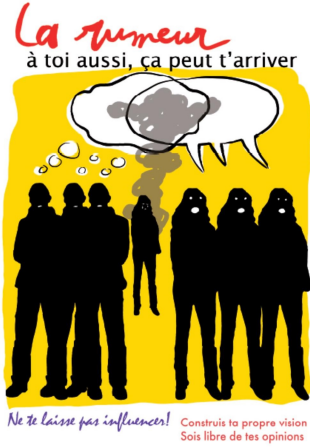
Collège J. Curie /Stains