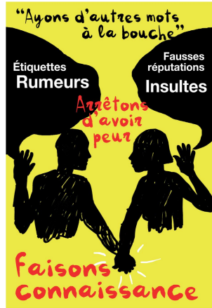
Collège V. Hugo /Noisy-le-Grand