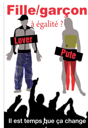
Collège F. Dolto /Villepinte