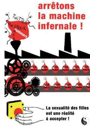
Collège Le Parc /Aulnay